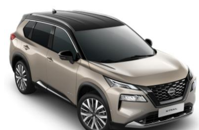
Pezsgőezüst - Fekete XEW – 420 000 Ft