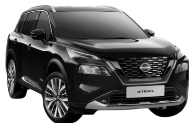
Fekete G41 – 200 000 Ft