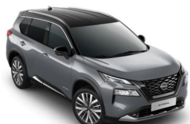
Gyöngyházsürke - Fekete XEX – 420 000 Ft