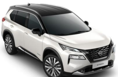
Gyöngyházfehér - Fekete XKJ – 420 000 Ft