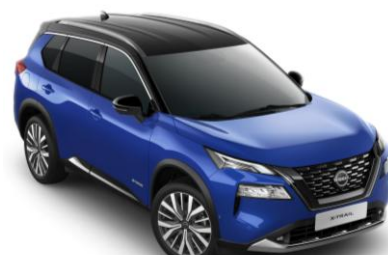
Kék - Fekete XEU – 420 000 Ft