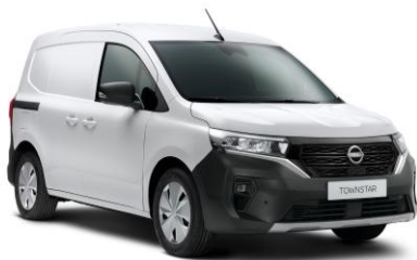
Fehér QNG – 0 Ft*