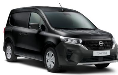
Enigma fekete GNE – 130.000 Ft*