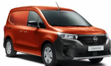
Terrakotta CNZ – 130.000 Ft*

*- a megjelenített árak ÁFA nélkül értendők