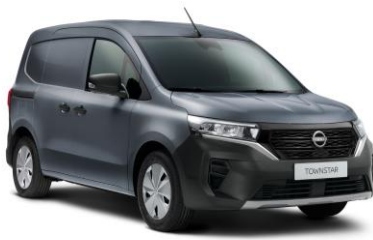
Szürke KPW – 70.000 Ft*