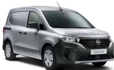
Gyöngyház szürke KQA – 130.000 Ft*