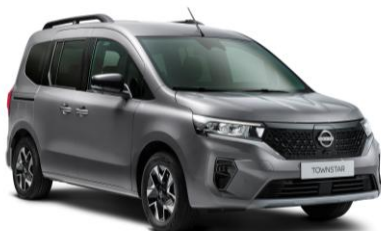
Casiopee Szürke KNG – 165.100 Ft