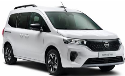
Fehér QNG – 0 Ft