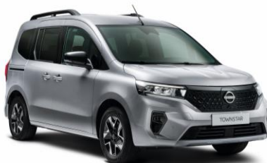
Gyöngyház szürke KQA – 165.100 Ft