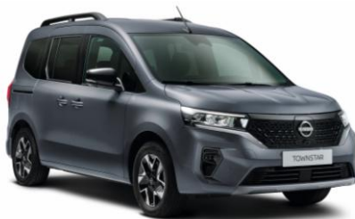
Szürke KPW – 88.900 Ft