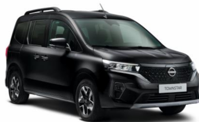
Enigma fekete GNE – 165.100 Ft