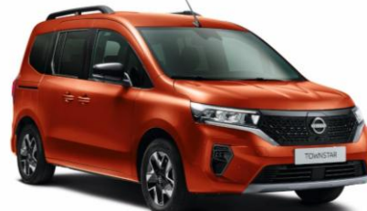
Terrakotta CNZ – 165.100 Ft