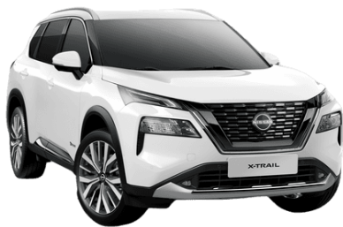
Alap fehér QAK