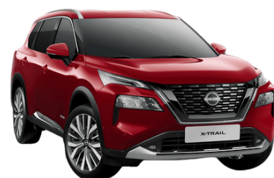
Sötétvörös NBL – 250 000 Ft