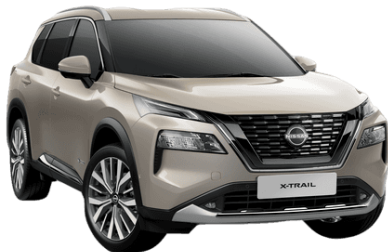
Pezsgőezüst KAY – 250 000 Ft