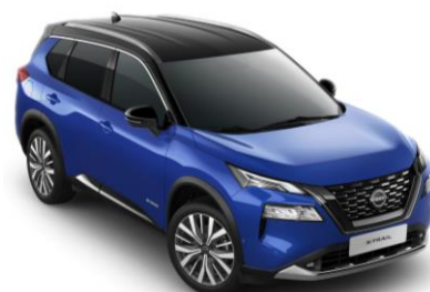
Kék - Fekete XEU – 410 000 Ft