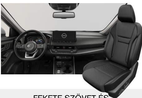
FEKETE SZÖVET ÉS SZINTETIKUS BŐRÜLÉSEK [G]