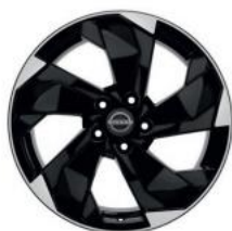
18"-OS KÖNNYŰFÉM KERÉKTÁRCSÁK