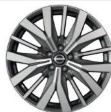
20"-OS KÖNNYŰFÉM KERÉKTÁRCSÁK (Opció)