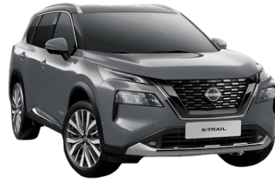
Gyöngyházzsürke KBY – 250 000 Ft