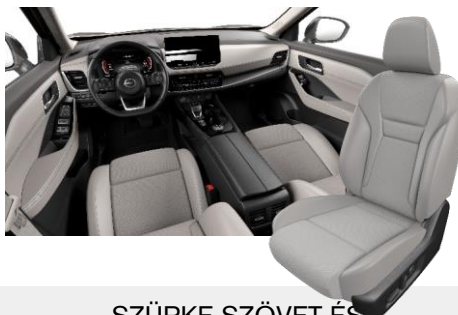
SZÜRKE SZÖVET ÉS SZINTETIKUS BŐRÜLÉSEK [K]