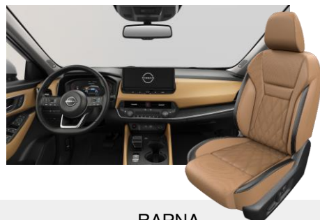
BARNA NAPPABŐR ÜLÉSEK [C]