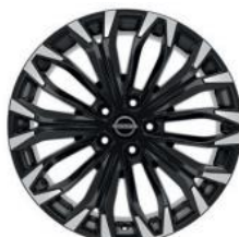
19"-OS KÖNNYŰFÉM KERÉKTÁRCSÁK