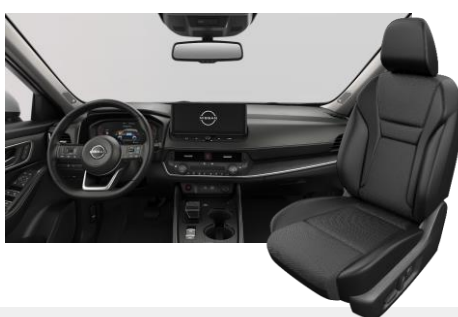
FEKETE SZÖVET ÉS SZINTETIKUS BŐRÜLÉSEK [G]