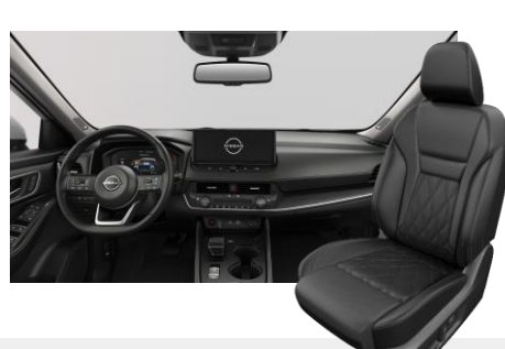
FEKETE NAPPABŐR ÜLÉSEK [G]