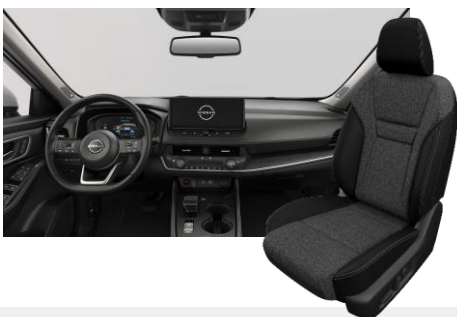
FEKETE SZÖVET ÜLÉSEK [G]