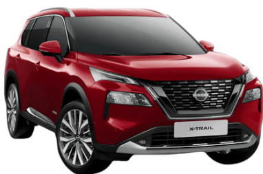
Sötétvörös NBL – 250 000 Ft