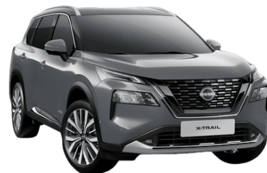
Gyöngyházzsürke KBY – 250 000 Ft