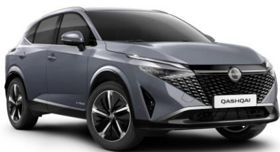
Gyöngyház szürke KBY – 240 000 Ft