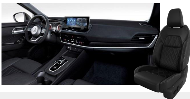
Prémium steppelt bőrlélek és Alcantara betétek [Z]