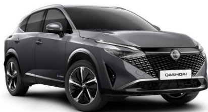
Szürke KAD – 200 000 Ft