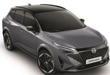
Szürke & Fekete XEX – 500 000 Ft