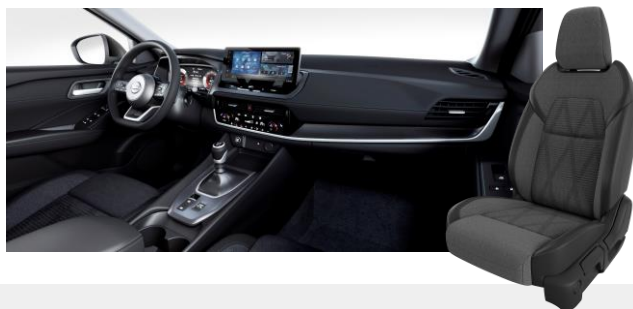
Szövet és szintetikus bőrlélek [G]