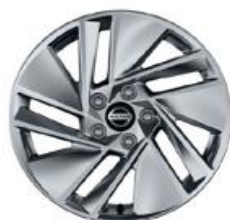
17"-OS KÖNNYŰFÉM KERÉKTÁRCSÁK