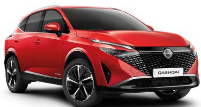
Naplemente vörös NBV – 240 000 Ft