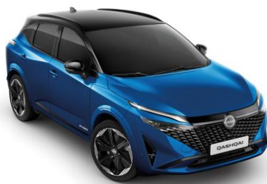
Kék & Fekete XGZ – 500 000 Ft