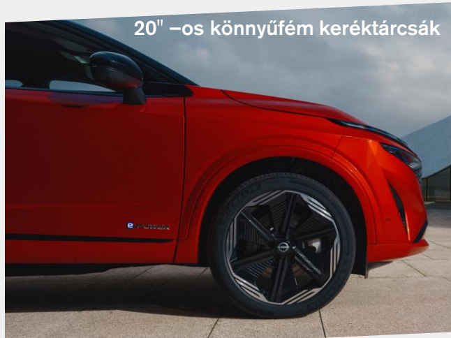
20" –os könnyűfém keréktárcsák