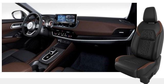
Sötétbarna és fekete szintetikus bőrlélek [H]