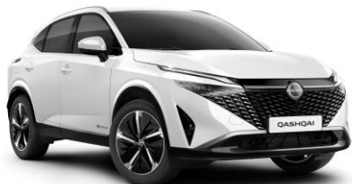
Gyöngyház fehér QBE – 240 000 Ft