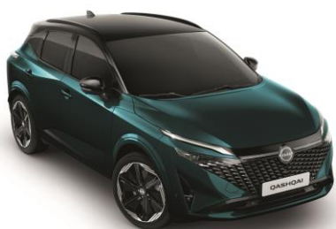
Mély óceán & Fekete YBJ – 500 000 Ft