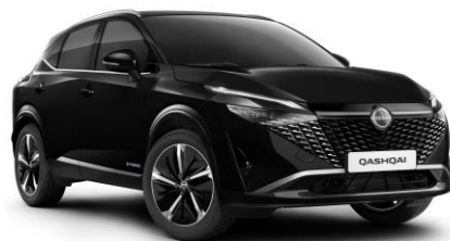
Fekete GAT – 200 000 Ft