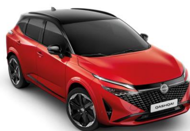
Naplemente vörös & Fekete YAU – 500 000 Ft