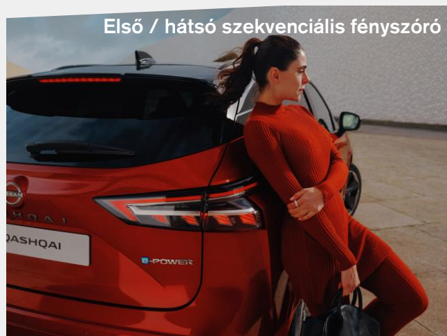
Első / hátsó szekvenciális fényszóró