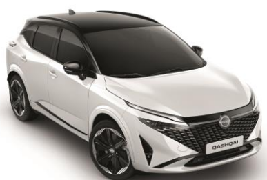
Gyöngyház fehér & Fekete XKJ – 500 000 Ft