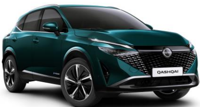
Mélyóceán FAP – 240 000 Ft