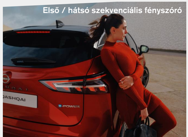
Első / hátsó szekvenciális fényszóró