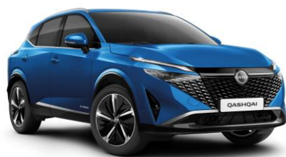
Kék RCF – 240 000 Ft