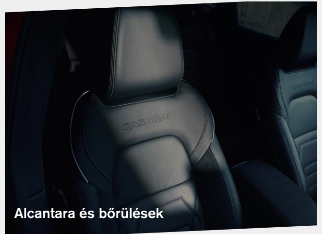
Alcantara és bőrülések