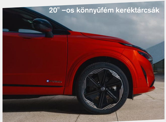
20" –os könnyűfém keréktárcsák