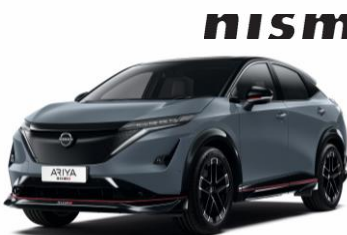
LOPAKODÓ SZÜRKE /FEKETE YAZ – 400 000 Ft