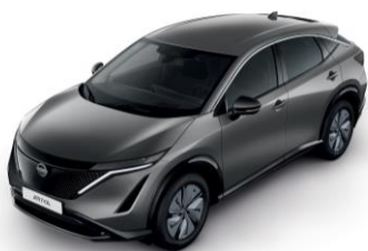
FEGYVERSZÜRKE KAD – 200 000 Ft