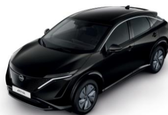
GYÖNGYHÁZFEKETE GAT – 200 000 Ft