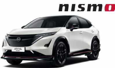
GYÖNGYHÁZFEHÉR /FEKETE XGA – 400 000 Ft