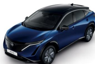
ÉJKÉK /FEKETE XGU – 400 000 Ft