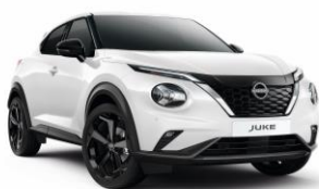
Fehér 326 – 70 000 Ft