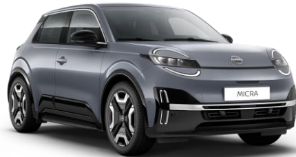
Elegánszüst* KQG – 160 000 Ft