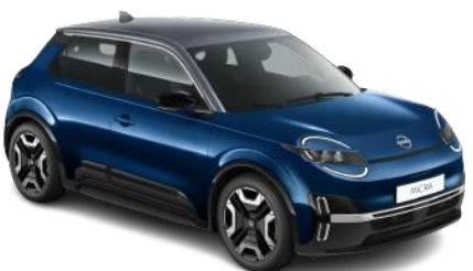
Tengeréskék / Szürke tető YWZ – 300 000 Ft

*ENGAGE felszereltség a csillaggal megjelölt színekben érhető el.