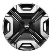
18" Iconic könnyűfém keréktárcsa