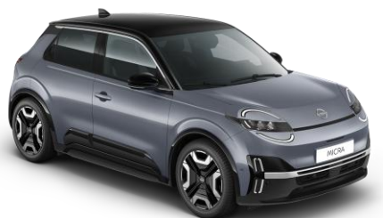
Elegánszüst / Fekete tető YUY – 300 000 Ft