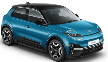
Boldogságbék / Fekete tető YZF – 300 000 Ft