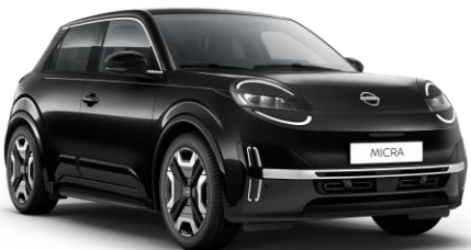
Misztikusfekete* GNE – 160 000 Ft