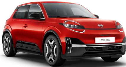
Lázadóvörös NPT – 160 000 Ft