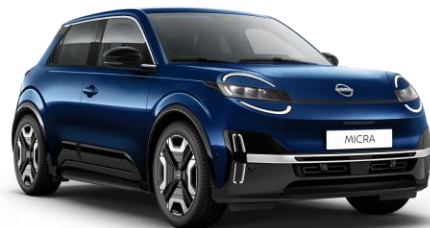
Tengeréskék RRE – 160 000 Ft