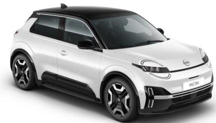
Hófehér / Fekete tető XUF – 300 000 Ft