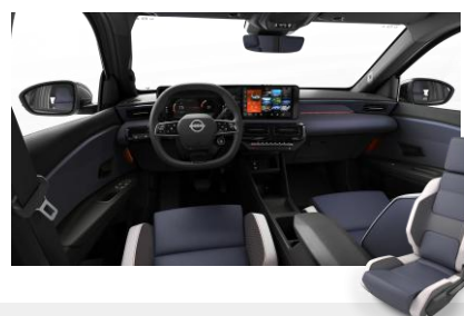
Sport belső Szintetikus bőr ülések