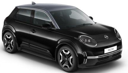
Misztikusfekete / Szürke tető YWX – 300 000 Ft