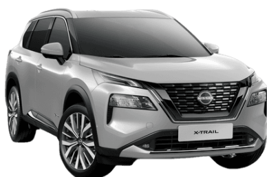
Ezüst K23 – 200 000 Ft