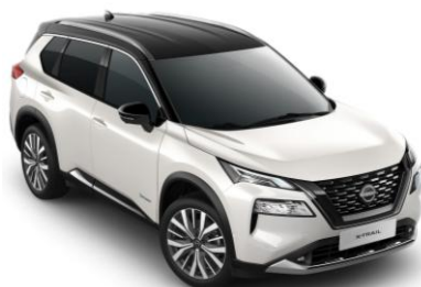
Gyöngyházfehér - Fekete XKJ – 420 000 Ft