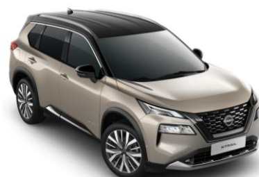
Pezsgőezüst - Fekete XEW – 420 000 Ft