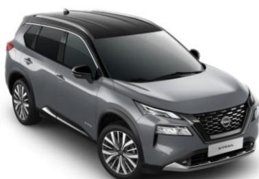
Gyöngyházzsürke - Fekete XEX – 420 000 Ft