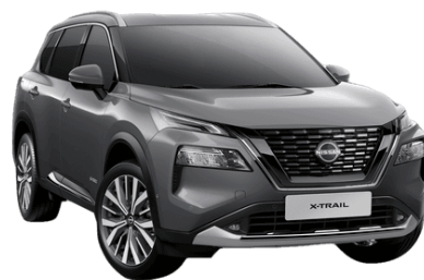
Szürke KAD – 200 000 Ft