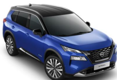
Kék - Fekete XEU – 420 000 Ft