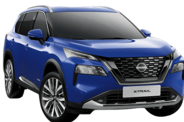
Kék RBV – 200 000 Ft