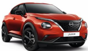
Naplemente vörös NBV - 0 Ft