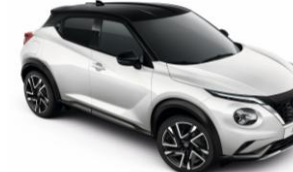
Fehér / Fekete XKJ - 290 000 Ft