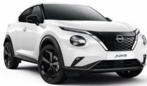
Fehér 326 - 70 000 Ft