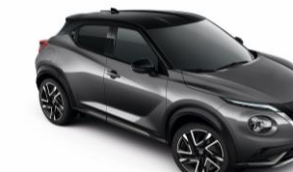
Szürke / Fekete GAQ - 290 000 Ft