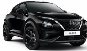
Gyöngyházfekete GAT - 160 000 Ft