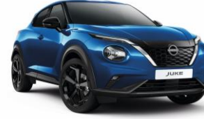
Élénkkék RCF - 160 000 Ft