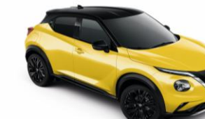
Sárga / Fekete YAS - 290 000 Ft