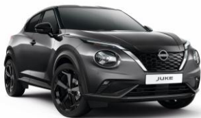
Szürke KAD - 160 000 Ft