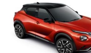
Piros / Fekete YAU - 290 000 Ft