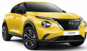
Sárga ECE - 160 000 Ft