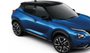
Élénkkék / Fekete XGZ - 290 000 Ft