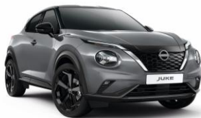
Gyöngyházsziürke KBY - 160 000 Ft