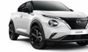
Gyöngyházfehér QBE - 190 000 Ft