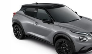
Szürke / Fekete XEX - 290 000 Ft