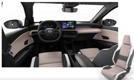
Zen belső – Szövet és szintetikus bőr ülések