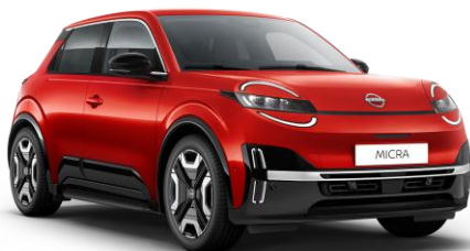
Lázadóvörös NPT – 160 000 Ft