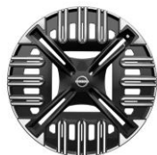
18" Acél keréktárcsa díztárcsával