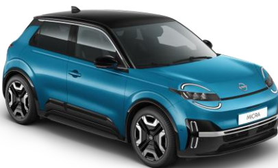
Boldogsággék / Fekete tető YZF – 300 000 Ft