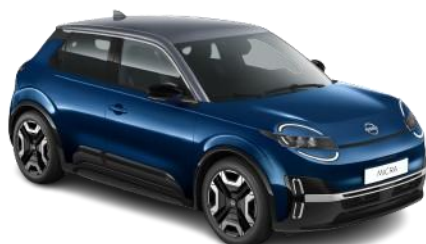
Tengerészkék / Szürke tető YWZ – 300 000 Ft

*ENGAGE felszereltség a csillaggal megjelölt színekben érhető el.