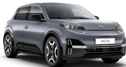
Elegánszüst* KQG – 160 000 Ft