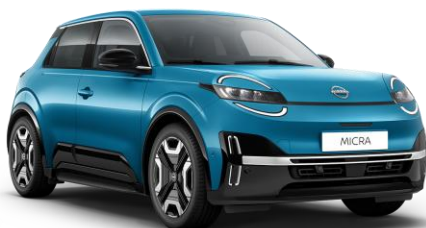
Boldogsággék RCN – 160 000 Ft