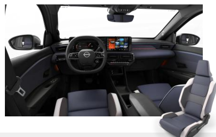
Sport belső – Szintetikus bőr ülések