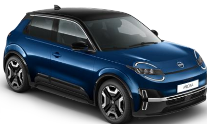
Tengerészkék / Fekete tető YWW – 300 000 Ft