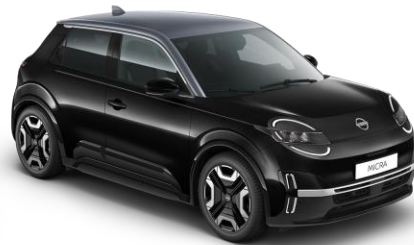
Misztikusfekete / Szürke tető YWX – 300 000 Ft