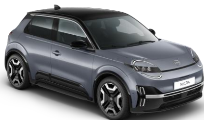
Elegánszüst / Fekete tető YUY – 300 000 Ft