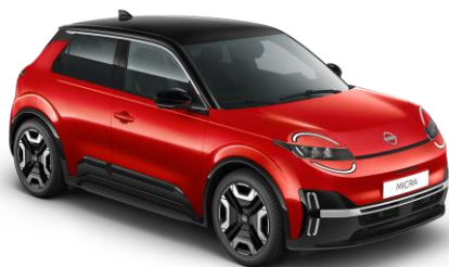
Lázadóvörös / Fekete tető YZA – 300 000 Ft