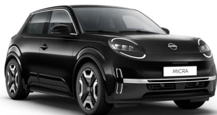
Misztikusfekete* GNE – 160 000 Ft