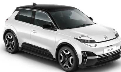
Hófehér / Fekete tető XUF – 300 000 Ft