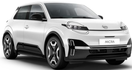
Hófehér* 369 – 0 Ft