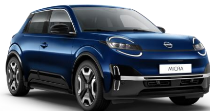
Tengerészkék RRE – 160 000 Ft